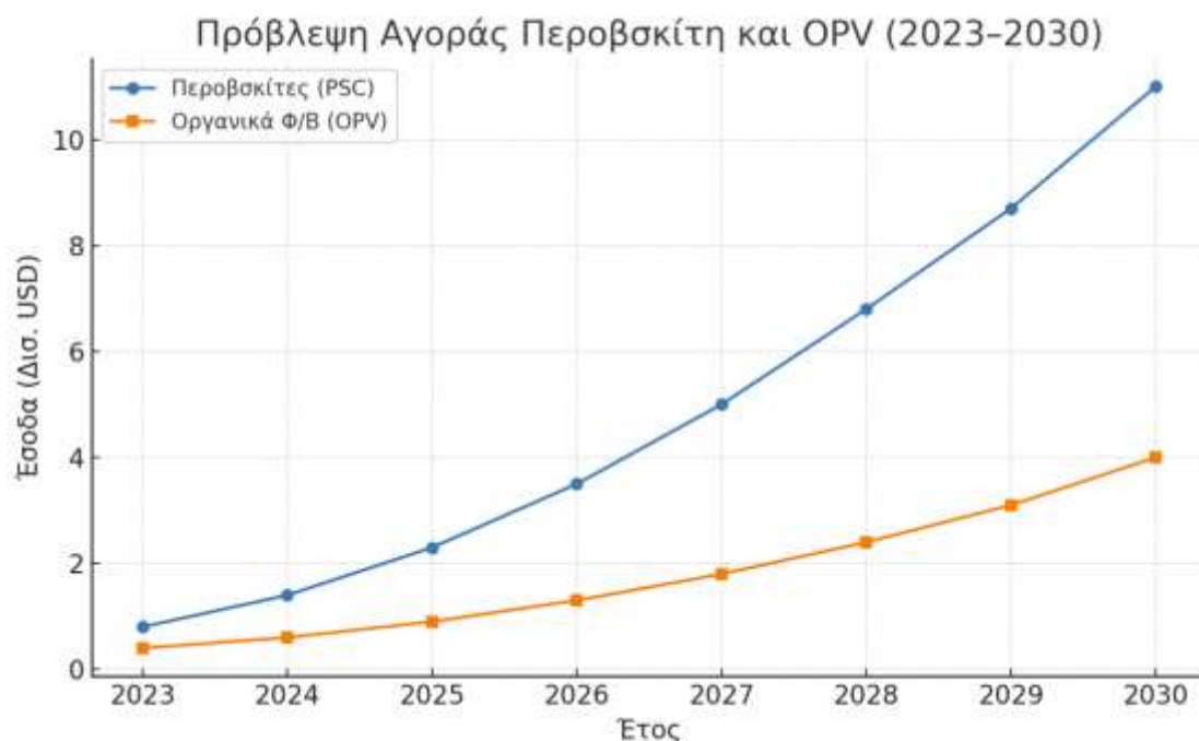
Διάγραμμα 1 – Εξέλιξη παγκόσμιας αγοράς PSC (2022–2028)

Για τα OPV, το momentum είναι διαφορετικό: οι αποδόσεις single-junction έχουν βελτιωθεί χάρη στους non-fullerene acceptors (NFA), ενώ οι τεχνολογίες εκτύπωσης R2R (gravure, slot-die, blade) μειώνουν θεαματικά το CAPEX/OPEX σε εφαρμογές όπου «μετρά» η ευκαμψία, το χαμηλό βάρος και η αισθητική περισσότερο από την απόλυτη απόδοση. Η εμπορική διεξόδου είναι niche-driven (IoT, ημιδιαφανή BIPV, φορητές λύσεις, lightweight mobile charging). Εδώ, το game-changer είναι η βιομηχανική αναπαραγωγιμότητα με σταθερές συνθέσεις και encapsulation που περνά τα βασικά πρωτόκολλα αξιοπιστίας (IEC 61215/61730).